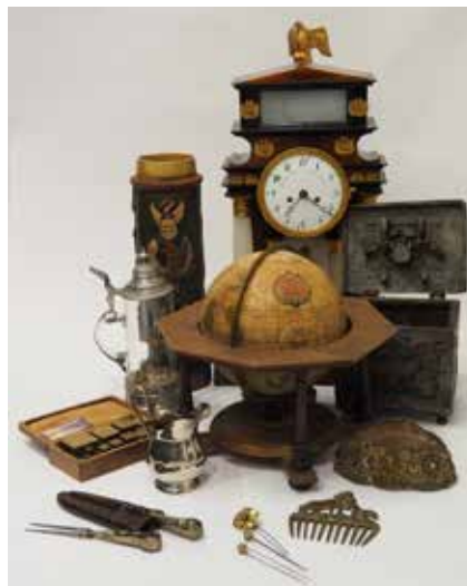
Ausstellungsstücke „Gesammelte Heimat“

seitig das Verständnis für Heimat war und ist. Dazu hat das Museumsteam aus den über 30.000 Stücken im Depot mehrere Gegenstände aus nahezu 3.500 Jahren Menschheitsgeschichte ausgewählt: Schönes, Kurioses, Kunstvolles, Lustiges und Wertvolles.