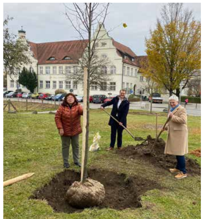
v. li. 3. Bürgermeisterin Christa Schmidbauer, 1. Bürgermeister Michael Hetzl und 2. Bürgermeisterin Ilse Preisinger-Sontag.

Wichtige Informationen zum Schutz der Bäume findet man unter www.muehdorf.de/308-Baumschutz.html