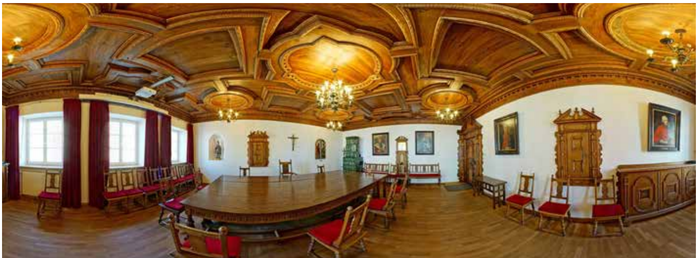
Ein Blick in den großen Sitzungssaal des Mühldorfer Rathauses durch die VR-Brille

Wer gerne auch so einen Blick in die 360 Grad Aufnahmen werfen möchte, kann dies unter „ www.panotour.info/3d/muehdorf “ tun. Viel Spaß!