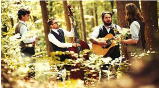
Johnny an the Yooahoos

Pläne für Haberkasten und Stadtsaal vorbehaltlich der dann geltenden Corona-Maßnahmen