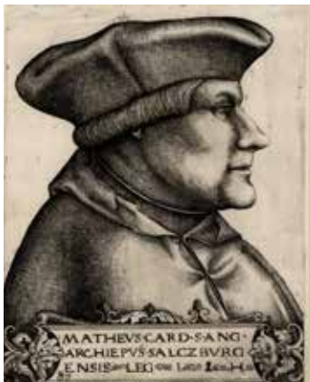
Erzbischof Matthäus Lang von Wellenburg.

Das Stadtgericht stand unter der Leitung des vom Salzburger Erzbischofs eingesetzten Stadtrichters. Am 23. Juli 1522 modifizierte Erzbischof Matthäus Lang von Wellenburg das Stadtrecht durch eine neue Stadtordnung umfassend. In der Stadt müssen zu dieser Zeit politische Querelen und Missstände geherrscht haben, denn in der Präambel ist in deutlichen Worten von „Widerwillen“, „Unlust“, „Aufruhr“ und „Irrungen“ die Rede. Die Stadtbevölkerung hatte sich ohne Erlaubnis der Obrigkeit und des Stadtrates auf den Straßen zusammengerotet, Gemeindeversammlungen abgehalten und gegen Rat und Stadtrichter opponiert. Der Streit hatte sich u.a. entzündet an den erhöhten Gebühren, die durch den Stadtschreiber erhoben wurden sowie an unangemessenen Inhaftierungen von Bürgern durch den Stadtrichter wegen geringfügiger Vergehen.