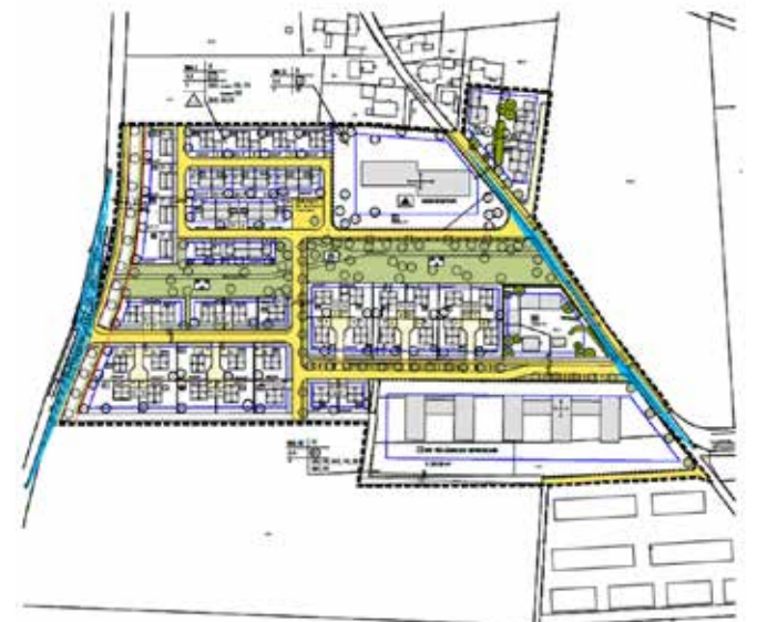
Grundstücke im Baugebiet „Am Kirchenfeld“

„Der Traum vom Eigenheim soll in Muehldorf a. Inn für junge Familien weiter möglich sein, dafür setze ich mich persönlich ein“, betont der Rathaus-Chef.